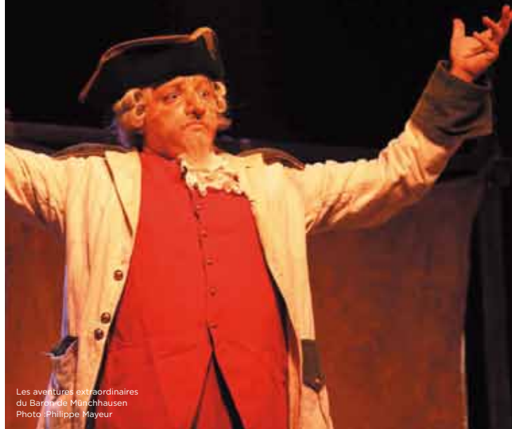
Les aventures extraordinaires du Baron de Münchhausen Photo : Philippe Mayeur