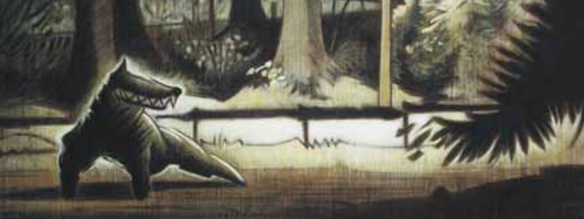
" Le loup " (détail) F. Vangeebergen