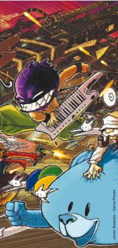
Janski Beeeats - Game Planet